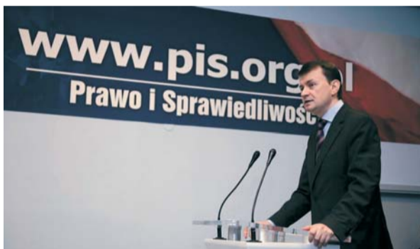
Poseł Mariusz Błaszczak, szef warszawskiego PiS