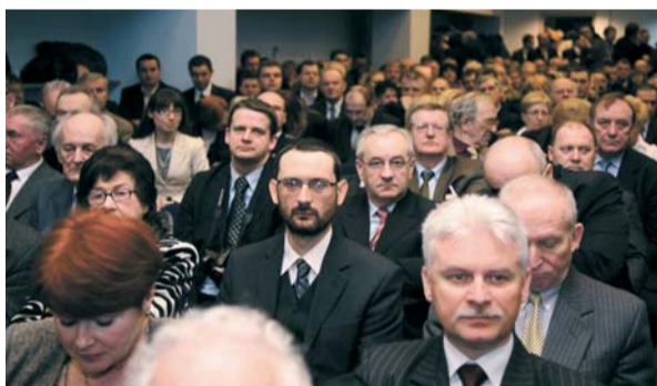
Delegaci na Zjazd warszawskiego PiS