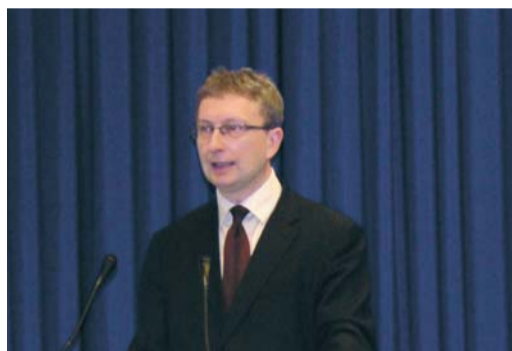
Poseł Artur Górski, warszawski poseł PiS